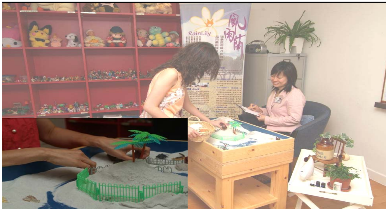
情緒輔導 – 沙池治療