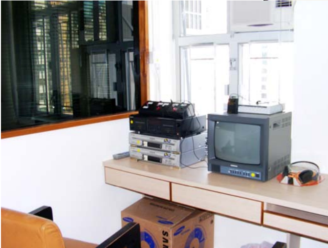
協助安排法醫探證