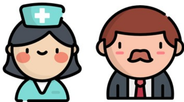
勞動市場垂直與水平性別隔離現象十分顯著