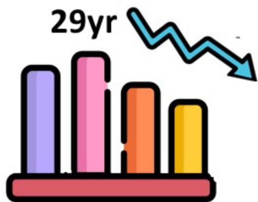
女性勞參率於婚育年齡後逐步下降