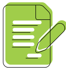
登記伴侶 (registered partnerships)