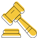
民事婚姻 (civil marriage)

2013年CEDAW委員會通過 第29號一般性建議 ，強調為了保護不同婚姻與家庭關係中的女性人權， 「家庭」的概念必須廣義來理解 ，至少包括：